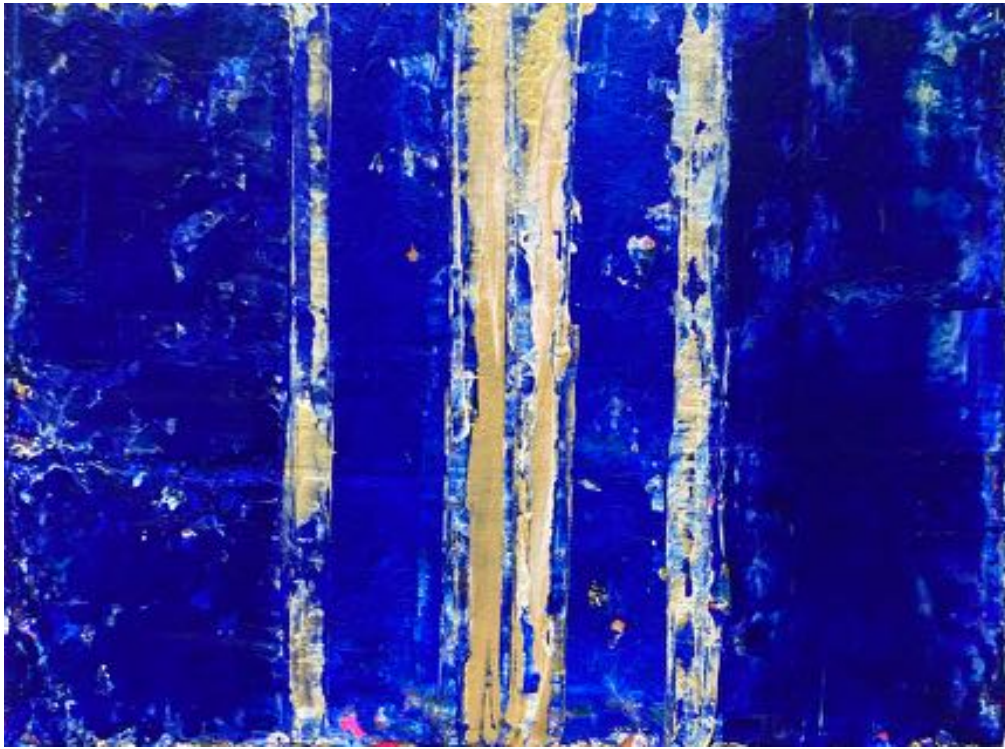
Espérer la mer