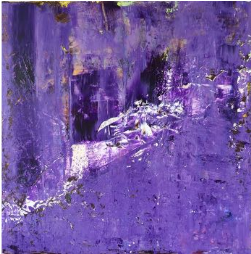
Dans la ville